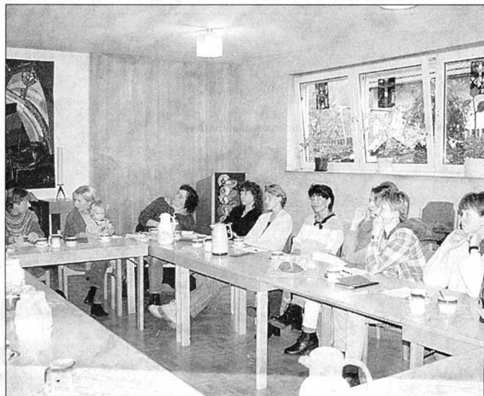
12 Mütter von Arche Noah-Kindergartenkindern folgten dem Vortrag über die Prinzipien alternativer Heilverfahren.

Naturheilkundler informierte im Kindergarten Arche Noah